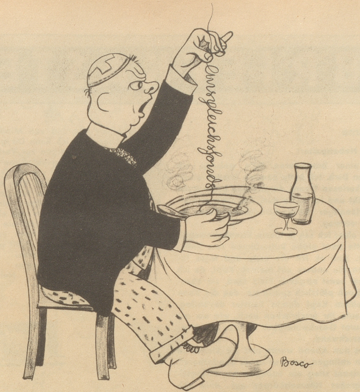
Das Haar in der Suppe

«Oh Mond! Da scheinst du nun un- bekümmert, wie du es seit längstens gewohnt bist, auf Gute und Böse, auf Recht und Unrecht. Noch nie hast du etwas an den Tag gebracht, wie die Sonne, die dir, gutem Mond, der du so stille gehst, in ihrer pompösen Auf-