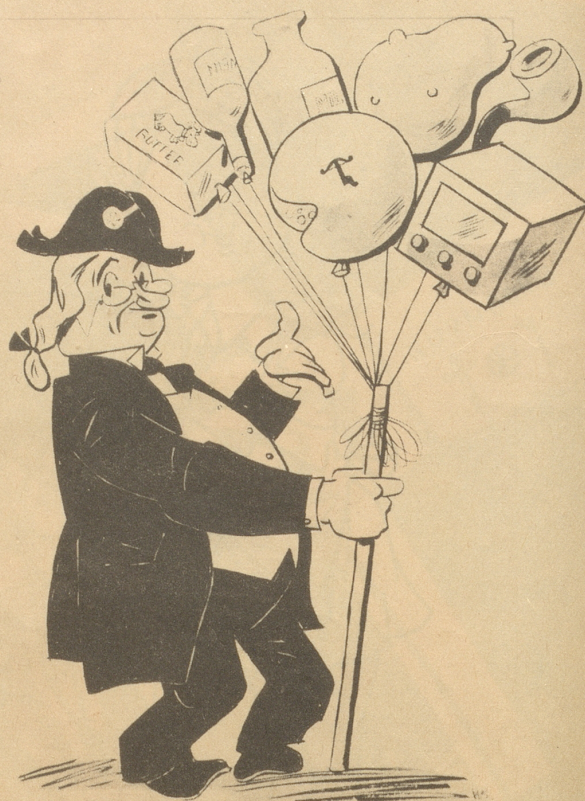
Milch - Käse - Butter - Kartoffel - Tabak - usw. - Preise steigen.