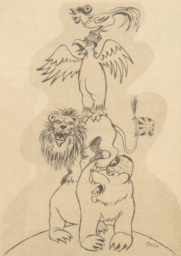
Die neuen Bremer Stadtmusikanten

«Nei — aber daß mir 's Usland au törfid lose!»