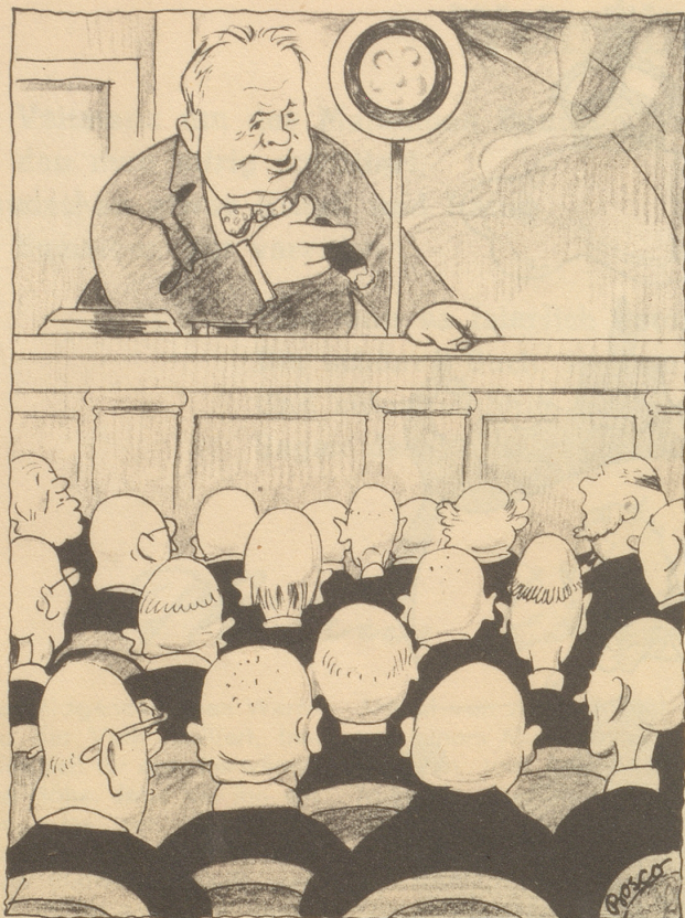
Churchill spricht zur akademischen Jugend