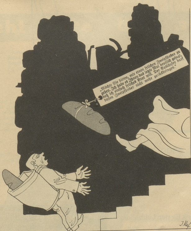
Laut „Schweiz. Bäcker- und Konditoren-Zeitung“ hat eine Frau eintägiges Brot mit der oben fixierten schriftlichen Erklärung zurückgewiesen.

„Unser täglich Brot gib uns heute, aber nu ganz frisches!“