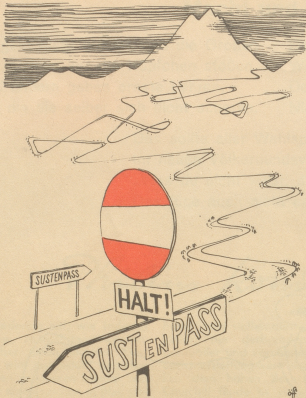
Verkehrsregelung in den neuerschlossenen Alpen