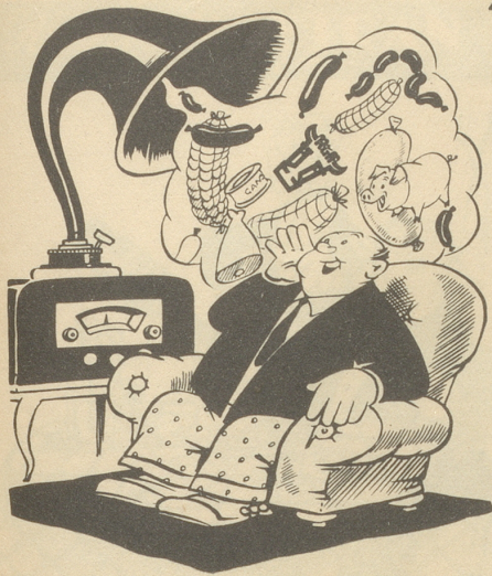
Der Genießer am Tag der Aufhebung der Rationierung!