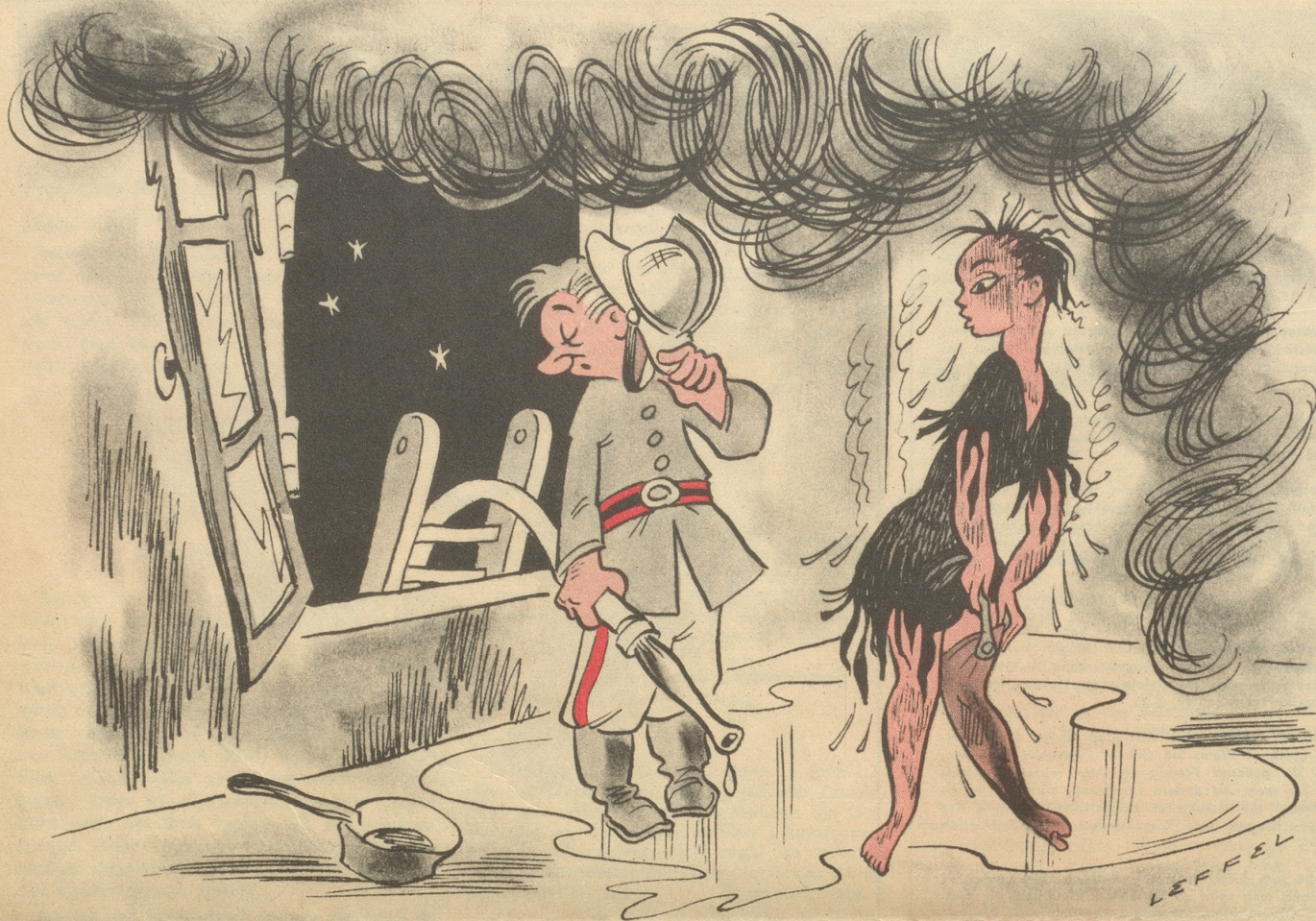
Der schüchterne Retter: „Au – entschuldigezi!“