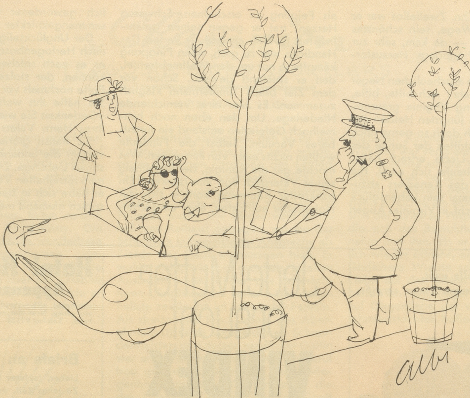
„Im Fall mini Frau chunt säged Si ich seig mit eme Fründ go fische.“