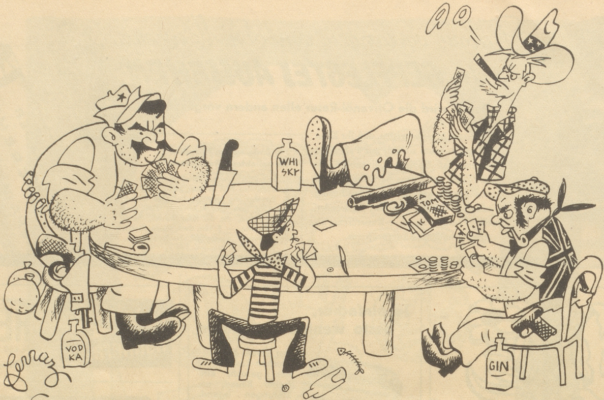
Man verleugnet die gute Kinderstube!