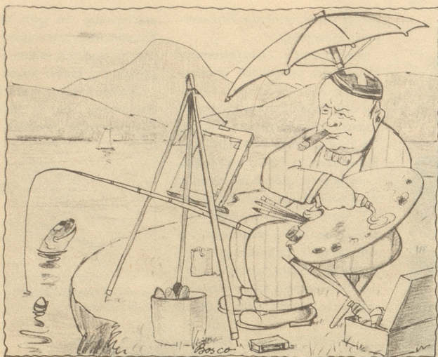
Churchill der Nimmermüde