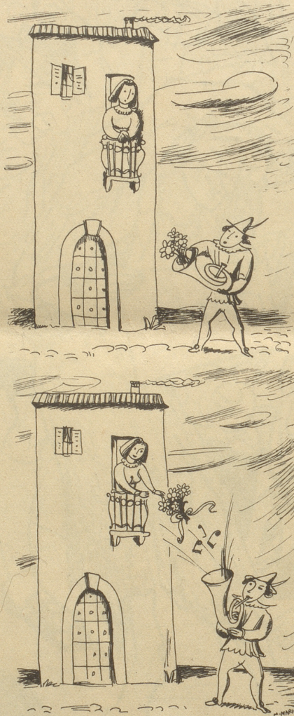
Aus der guten alten Zeit.

«Die Franzosen sprechen zuerst, dann handeln sie. Die Engländer sprechen und handeln gleichzeitig. Die Amerikaner handeln zuerst und sprechen nachher. Die Russen schweigen und handeln, und die Chinesen hören nicht auf mit reden!»