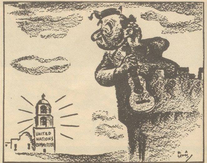
Franco: Wieviel hets gschlage? (The Milwaukee Journal)