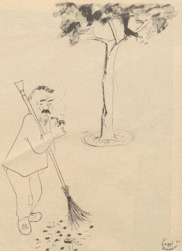
„Isch ächt de Tschörtschill scho choo?“