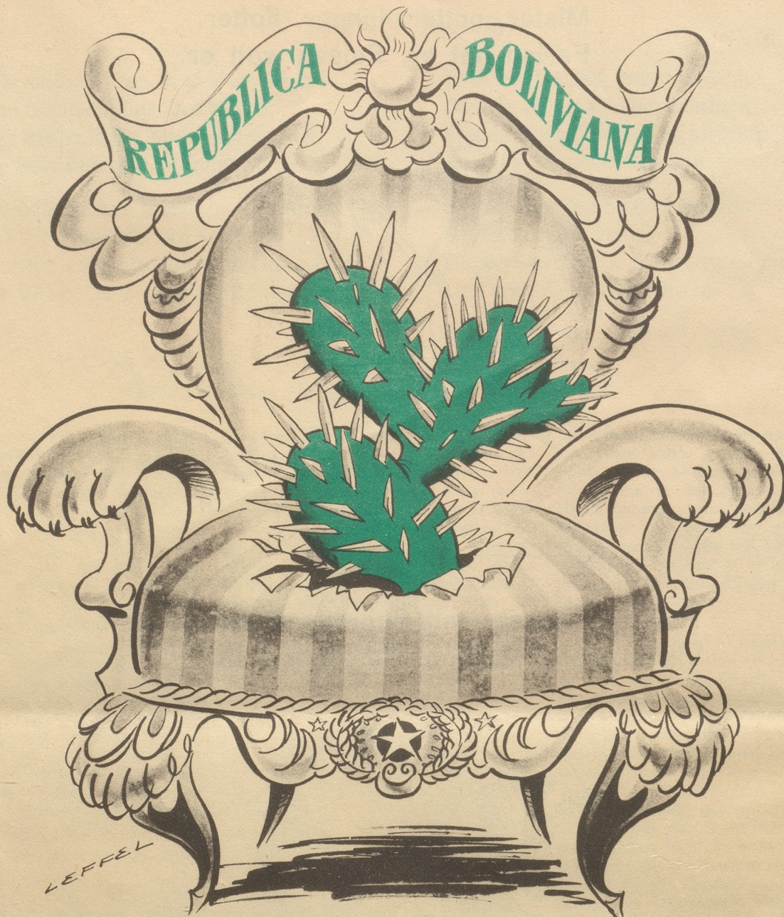
Der Sitz des Präsidenten