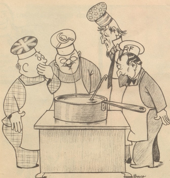
Pariser Küche „Immer schpeuzt er i d'Suppe!“