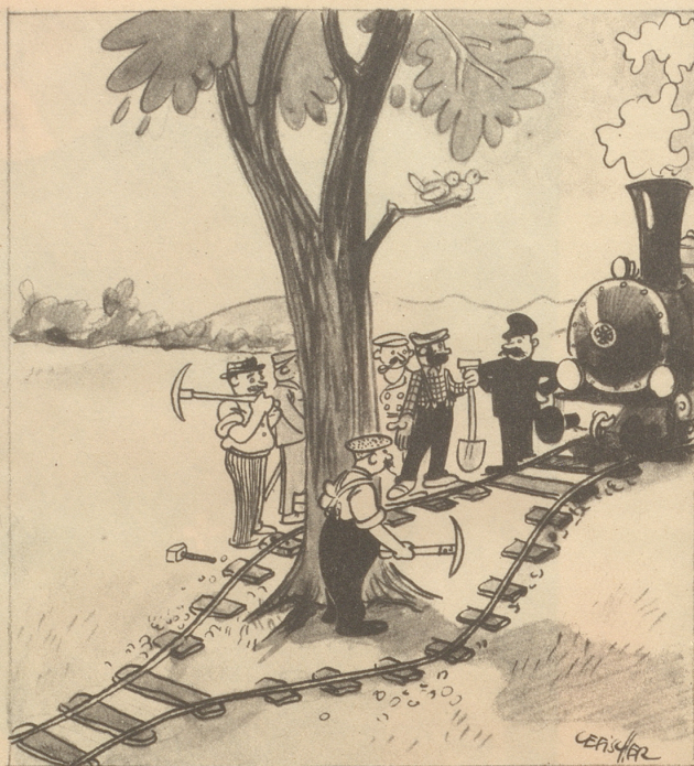
„Die einte händ wele links am Baum dure und die andere rächts, jetz hämmer is e so g'einiget!“