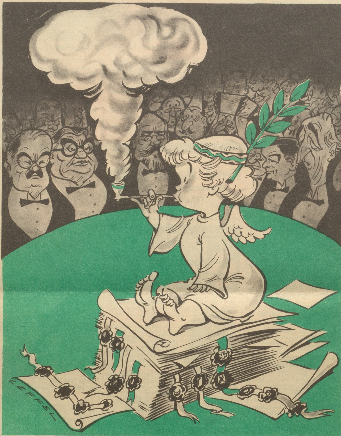
Die Friedenspfeife A was erinnert etz au dä Rauch?