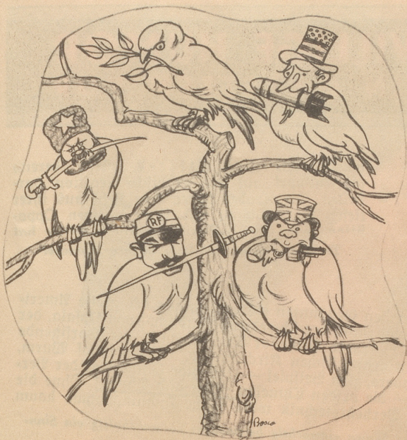
Tauben, lauter Tauben!