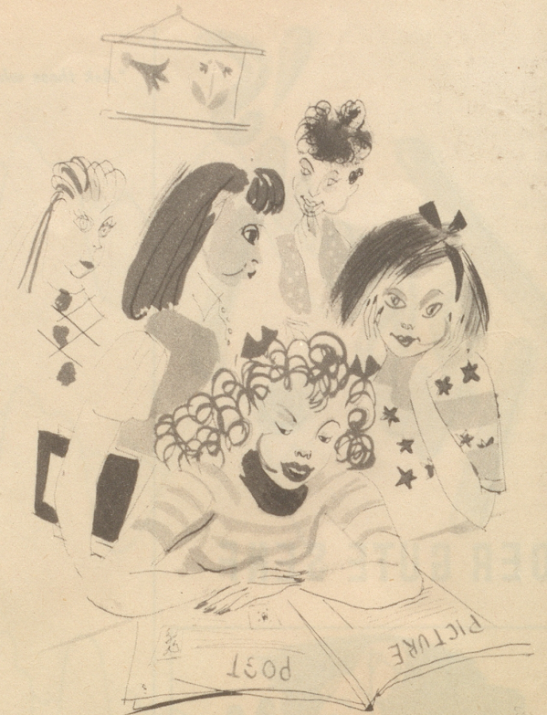
Die höhere Tochter:

„De Tschonny seit, sit ich Chaugummi chätschi sig mi änglisch Uusschproch vill besser.“