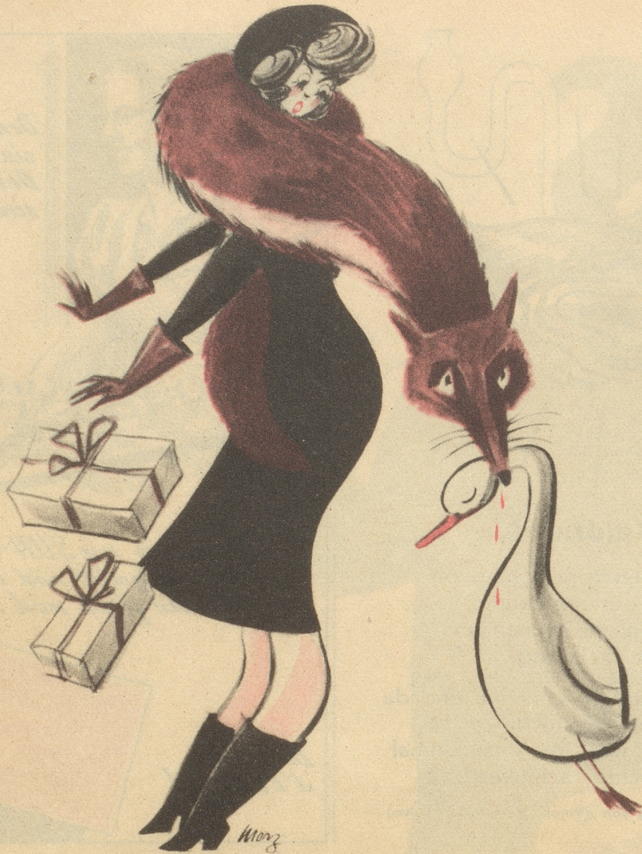
Er kann es noch immer nicht lassen