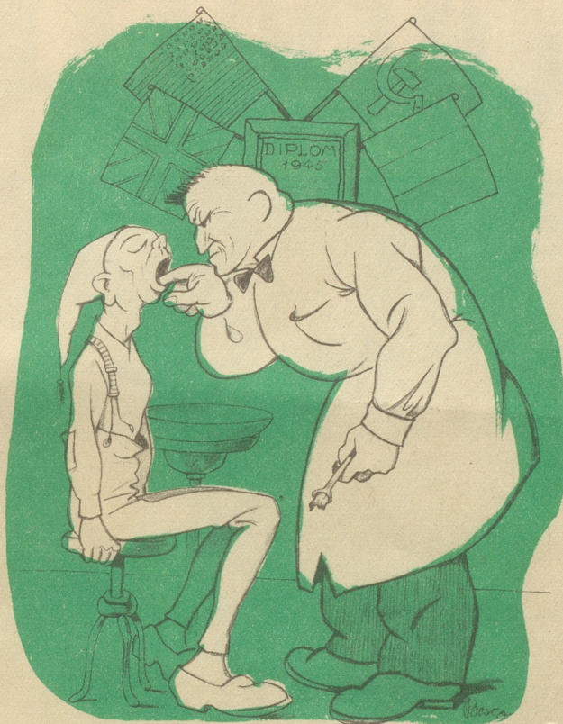
Der deutsche Michel und sein neuer Zahnarzt