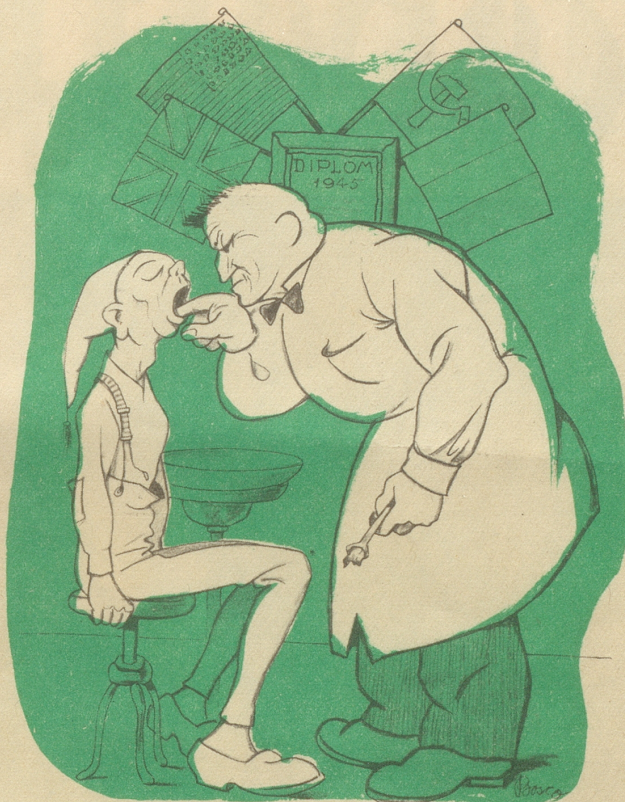
Der deutsche Michel und sein neuer Zahnarzt

«Da nun meine Handlungen strafbar sind, so möchte ich Sie höflich bitten nicht zu streng zu sein, da ich es jedenfalls nicht nötig habe.»