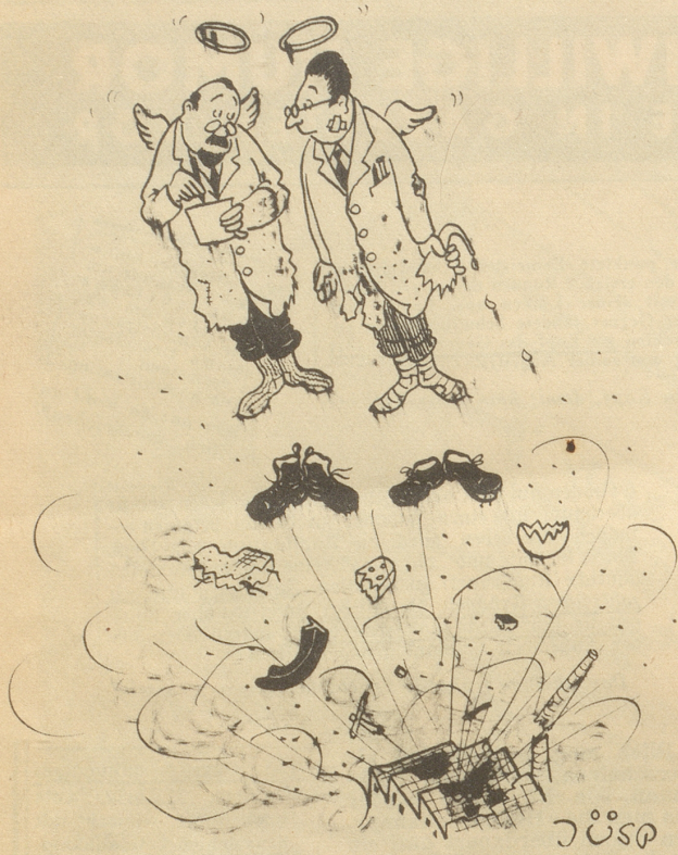
„Wievil Atömli hämmer jetz au am Schluß no gnoo, Herr Kollega?“