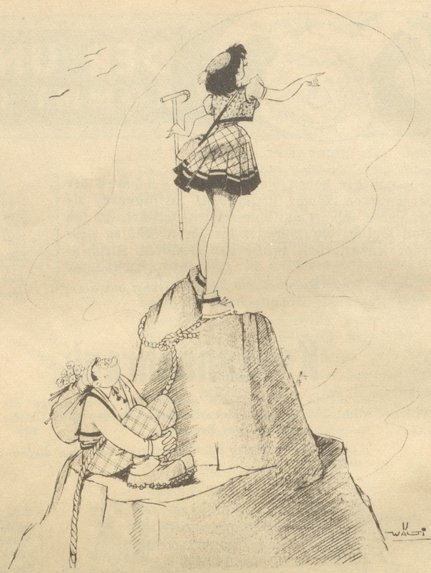
„Oh, scho lang han ich kei söttig imposants Panorama mee gsee!“ „Ich au nid!“