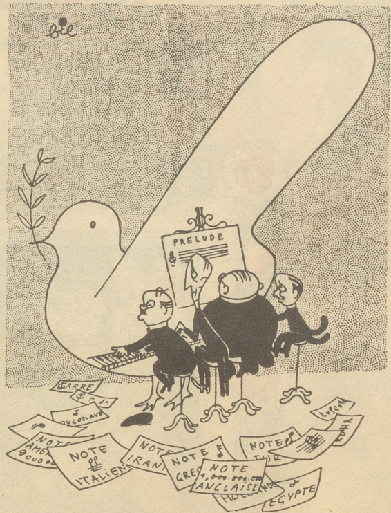
Die Noten wären da; jetzt müßten sie nur noch die Akkorde finden. Ici Paris