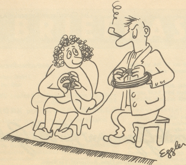
„Werum wotsch etz plötzli sidigi Socke?“