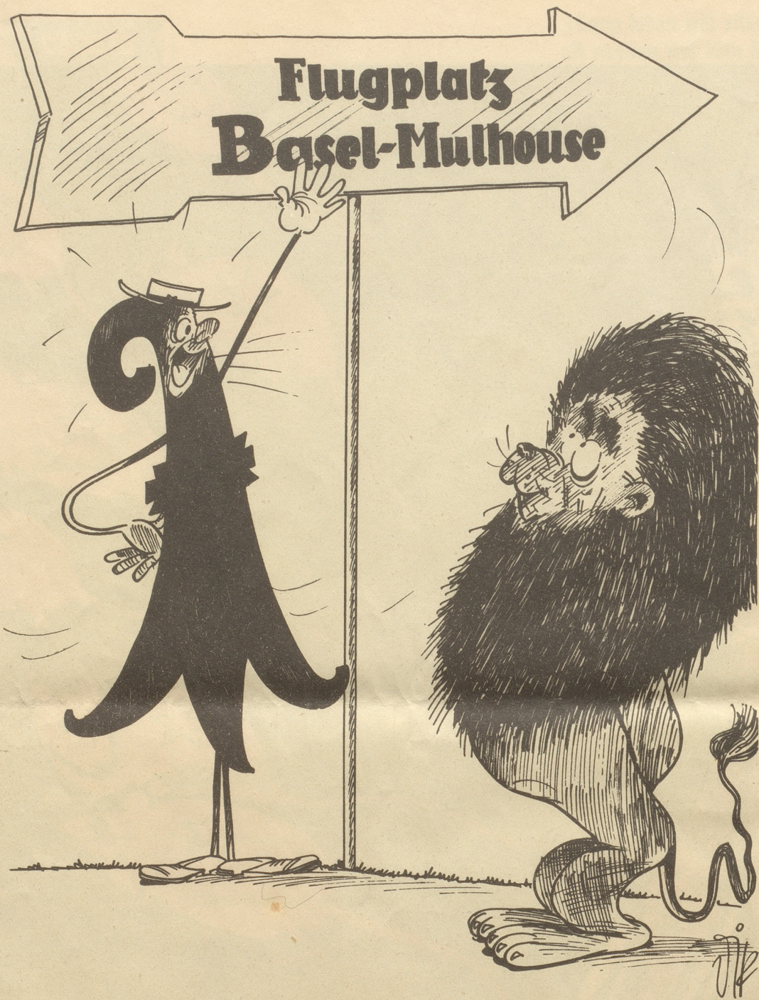
Flugplatz Basel-Mulhouse in 8 Wochen erstellt!

Man darf das ein Bravourstück nennen, Selbst Züri muß es anerkennen!