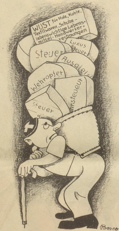
Wenigschtens 's überscht Päckli törfids mr eweg nää!