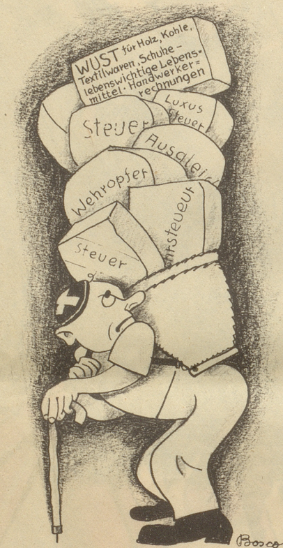
Wenigschtens 's überscht Päckli törfids mr eweg nää!