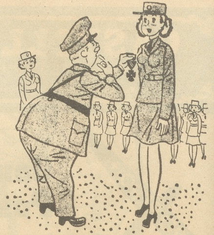
Die Qual der Wahl. Lite

«Housi, was hesch z'hinke?» «I ha-n-es Loch im Socke!» Kröte