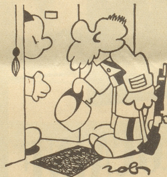
Schließung der Kasernen

«Ich komme zur Instruktion im Karabinerschießen!»