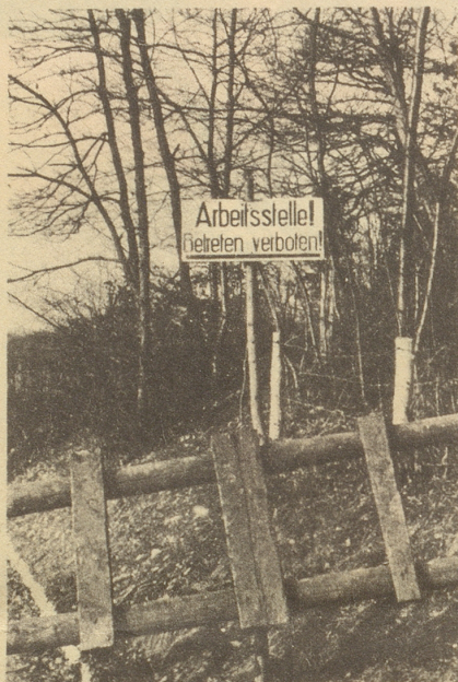
So eine Stelle habe ich schon immer gesucht! Xandi.

In Zürich ist ein Bund ehemaliger Konzentrationslager-Häftlinge gegründet worden, der u. a. den Zweck verfolgt, das materielle Los der Mitglieder erträglicher zu gestalten. An der Gründungsversammlung rief ein ehemaliger Insasse eines Konzentrationslagers in einem leidenschaftlichen, Ap-