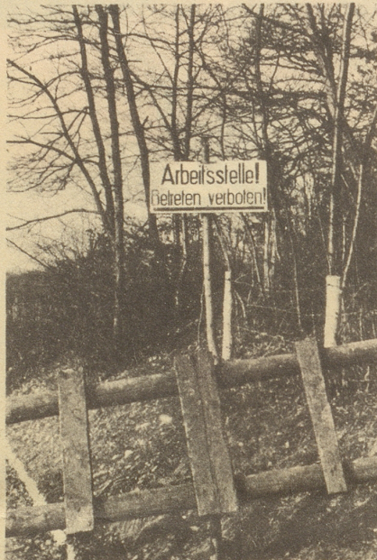
So eine Stelle habe ich schon immer gesucht! Xandi.

In Zürich ist ein Bund ehemaliger Konzentrationslager-Häftlinge gegründet worden, der u. a. den Zweck verfolgt, das materielle Los der Mitglieder erträglicher zu gestalten. An der Gründungsversammlung rief ein ehemaliger Insasse eines Konzentrationslagers in einem leidenschaftlichen, Ap-