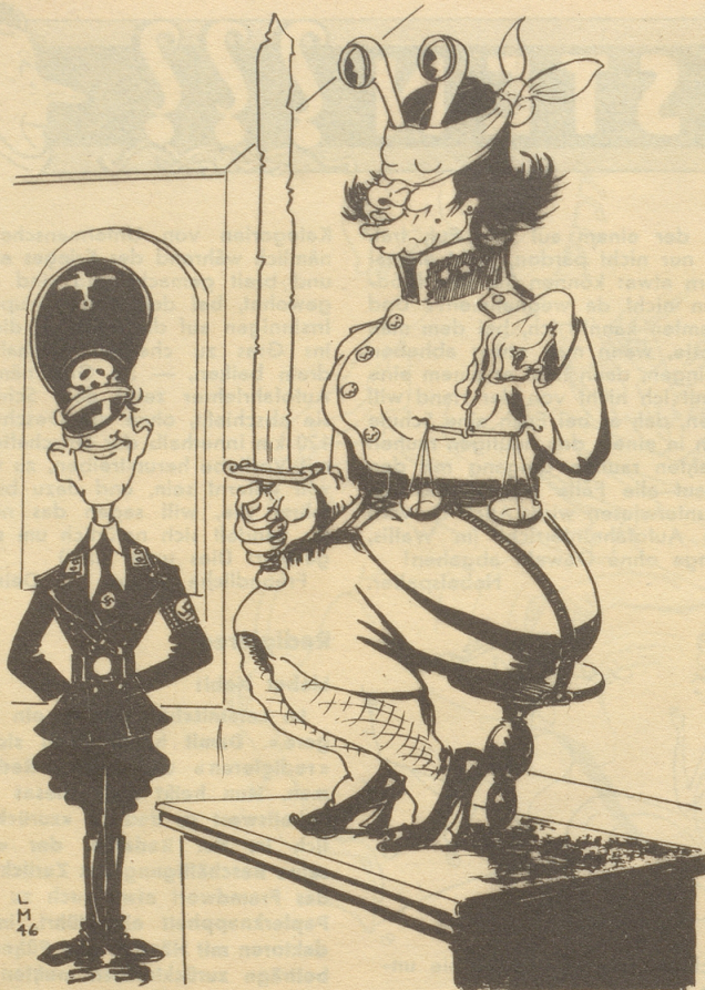
Urteil gegen einen Schweizer Sturmbannführer 2 Jahre Gefängnis!

Verwendet unsere Militärjustiz in gewissen Fällen das Scherenfernrohr?