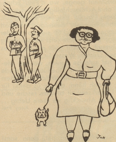
„Lueg Heiri, ä flügendü Feschtig mit Glaskanzle!“