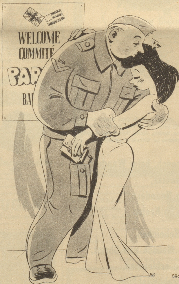
Amerikanische Urlauber beklagen sich, daß sie in den Pariser Vergnügungsstätten finanziell ausgebeutet wurden.

Im Anschluß an ein Gespräch am Familientisch über die berufliche Weiterbildung des Sohnes, sagte das achtjährige Töchterchen unvermittelt: «I will schpöter nüüt wärde, das choschfiet z'vill!» Auf die Frage, was es denn später, d.h. nach der Schule werden wolle, erwiderte es prompt: «Hüroote!» Hierauf erklärte man ihm, auch eine Frau die heiraten wolle, müsse vorher etwas lernen. «Aber d'Mutti isch doch au nüüt gsy — und isch glych ghürote worde!» war darauf die schlagfertige Antwort der Kleinen. W. J.