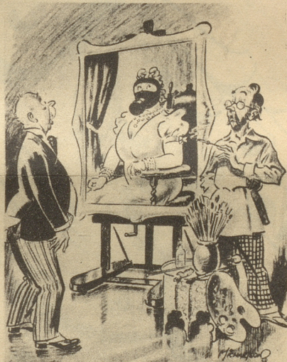
«Unglücklicherweise war gerade Fliegeralarm, als ich Ihre Frau malte.» Illustrated

Es herrschte ein Moment Todesstille! der Offizier konnte aber sein Lachen nicht mehr unterdrücken; auch wir übrigen Mitreisenden nicht. C. B.