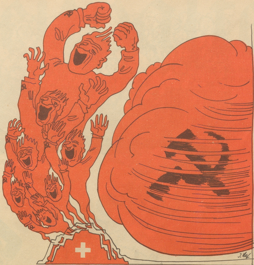
Nicole, Hofmaier und Konsorten

Mit Tram Nr. 7 bis „Bucheggplatz“ Telephon 26 25 02 Hans Schellenberg-Mettler