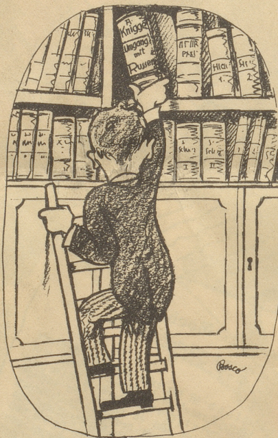
Dr. Max Petitpierre hat sein Amt als Bundesrat angetreten

Schreib' es Dir auf, ja nicht vergessen: Im „Central“ kannst Du prima essen.