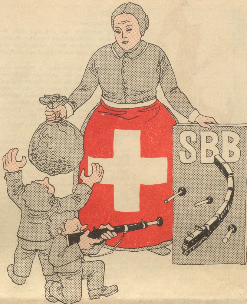
Das Schwyzervolk hatte am 21. Januar auch über die Sanierung seiner Südostbahn abzustimmen, die nur mit der vom Bund gewährten Privatbahnhilfe möglich ist. Die Ostbahnvorlage wurde angenommen, das Bundesbahngesetz bachab geschickt.