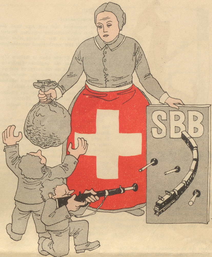
Das Schwyzervolk hatte am 21. Januar auch über die Sanierung seiner Südostbahn abzustimmen, die nur mit der vom Bund gewährten Privatbahnhilfe möglich ist. Die Ostbahnvorlage wurde angenommen, das Bundesbahngesetz bachab geschickt.