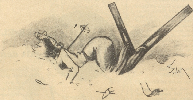
Im Zeichen des „V“ O du Veronika!