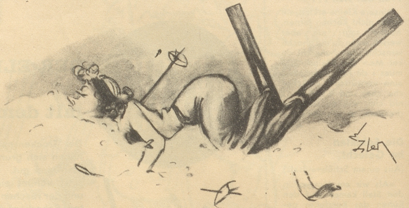
Im Zeichen des „V“ O du Veronika!