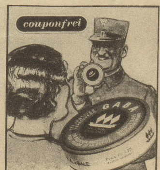
„Oh, ich habe immer eine Schachtel Gaba bei mir; Sie sollten auch Gaba im Haus haben, gerade in dieser Jahreszeit, denn Gaba beugt vor.“