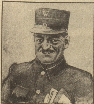
Der Briefträger ist gut Freund mit seinem ganzen Bezirk; er kennt alle und alle kennen ihn.