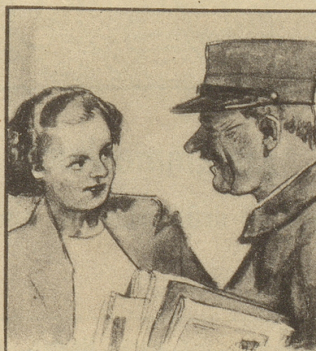
„Haben Sie nicht Angst vor Ansteckung?“ fragt sie, „Sie haben doch einen schweren Beruf.“