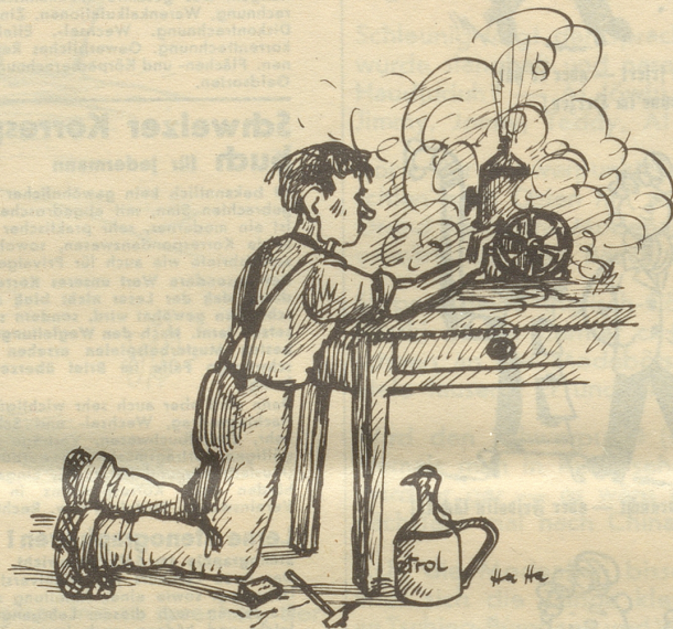
... Immer heftiger gab ich dem Schwungrad an ...

Wieder landete ich in meinem ersten Geschäft. Diesmal lief ich mir die 65-fränkige