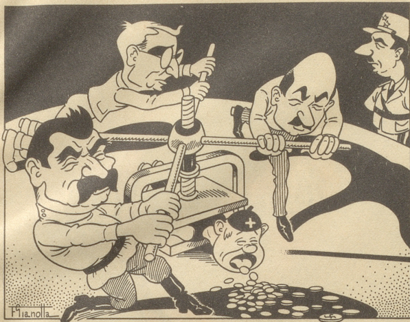
Die Alliierten, das deutsche Geld und wir