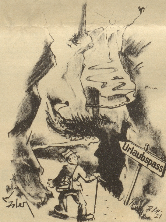
Ein mühseliger Pass