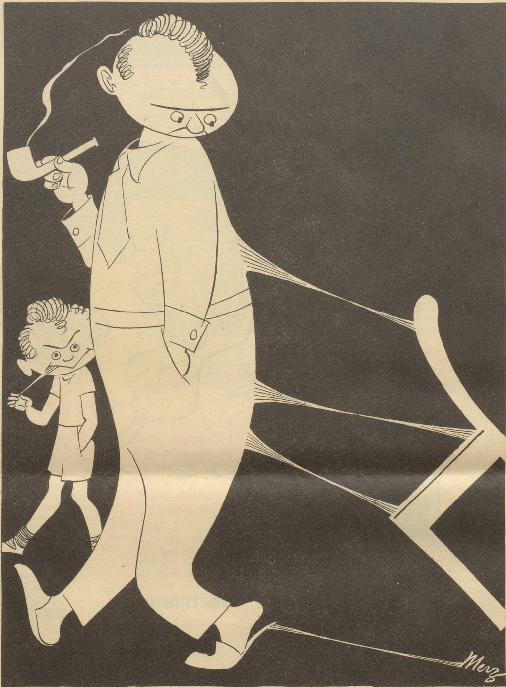
Unsere Jugend schwärmt für die Gepflogenheiten der amerikanischen Urlauber