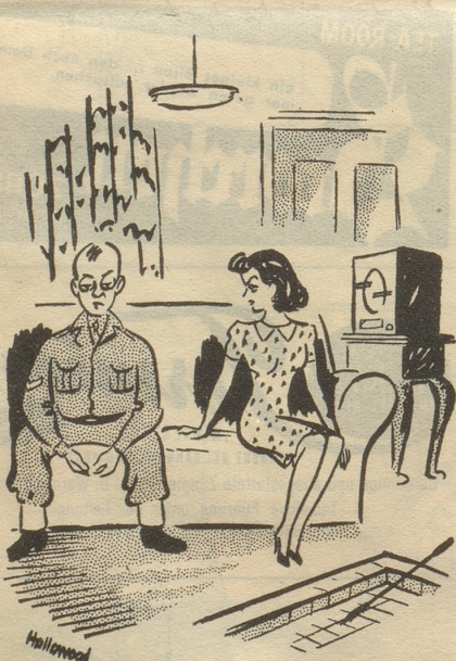
«Entschuldigen Sie, Fräulein, aber ich habe glatt vergessen, wie man fraternisiert.» London Opinion