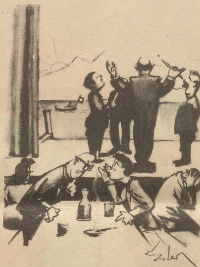
Eidg. Wahlen vom 25. November 1945 Stimmbeteiligung 53%, also relativ gut!

Aus «Doktor Dorbach, der Wühler und die Bürglenherren in der Weihnachtsnacht anno 1847.» E.