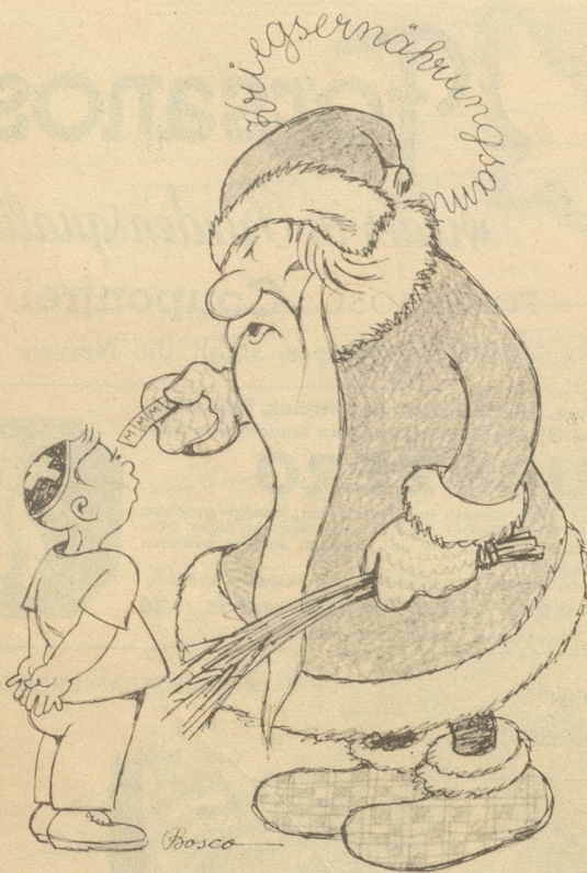
Das Kriegsernährungsamt schenkt uns auf die Festzeit vier Mahlzeitencoupons.

«Lueg was dr de Chlaus bringt! Wie seischt!»