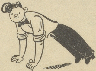
Jeden Tag macht Fridolin seine Turnübungen.