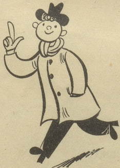
Jeden Monat aber kauft er sich mindestens ein Los der Landes-Lotterie — er will keine Chance ungenützt lassen!