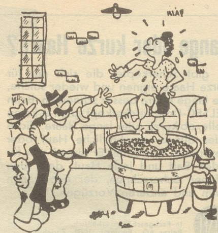
«Ich habe einen Swingbruder, angestellt — und es geht schneller.»