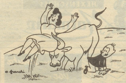
«Oh, Hektor! Wie Du stark bist!» Bilder aus Paysage-Dimanche