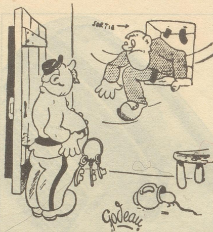
«Und Sie kommen zurück?» «Ganz aussichtslos eine Wohnung zu finden.»