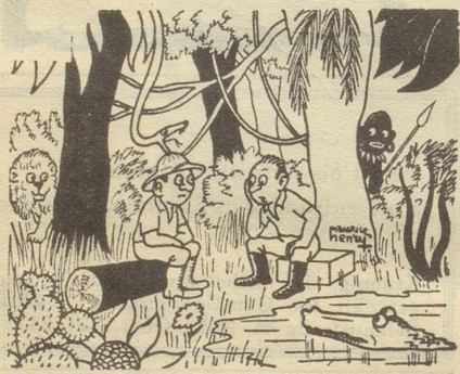
«... und wir haben nicht einmal einen Abenteuerroman, um uns zu unterhalten ...»